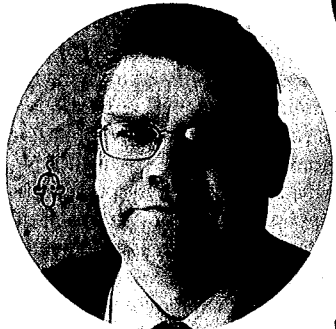
Missä EU, siellä Soini. Perussuomalaisten puheenjohtaja päätti venkoilunsa ehdokkuuteen.

Viime vaalikaudenkin pääasiat, ilmasto- ja energiapolitiittiset rajoitukset, kemikaalivi-