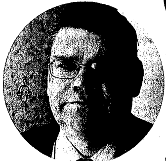
Missä EU, siellä Soini. Perussuomalaisten puheenjohtaja päätti venkoilunsa ehdokkuuteen.

Viime vaalikaudenkin pääasiat, ilmasto- ja energiapolitiittiset rajoitukset, kemikaalivi-